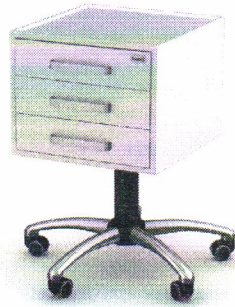
Zdjęcie ma charakter poglądowy.