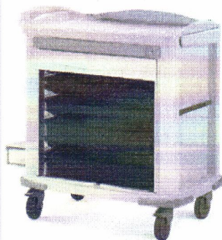
Zdjęcie ma charakter poglądowy.

zintegrowanych z korpusem wózka prowadnicach; cztery obrotowe koła, w tym dwa z hamulcami; z boku wózka uchwyt?