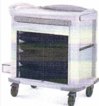
Zdjęcie ma charakter poglądowy.