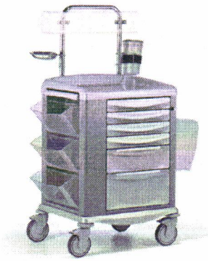
Zdjęcie ma charakter poglądowy.