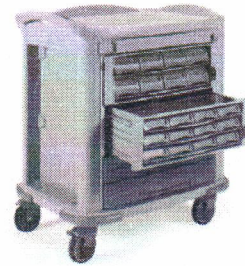
Zdjęcia mają charakter poglądowy.